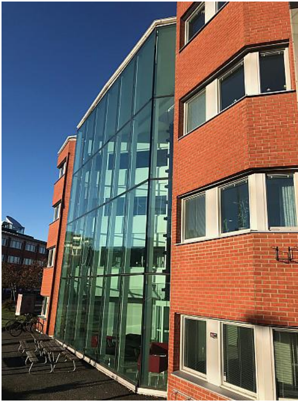
LOKAL 2 277 kvm