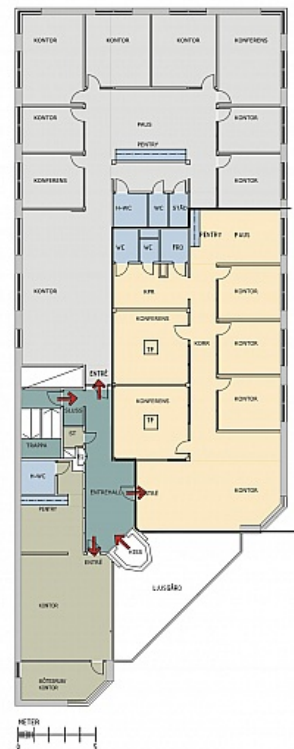
LOKAL 3 209 kvm